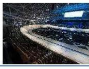
【記念まつり会場 千葉JPFドーム】