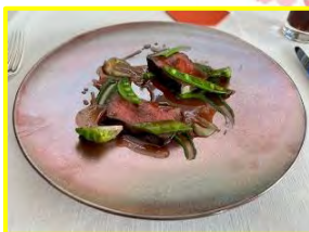
国産牛ロース肉のグリル