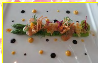
アスパラガスと、天使の海老のマリアージュ