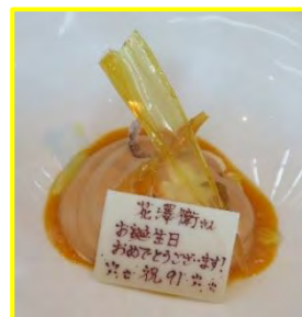
マンゴーとバニラアイスのデザート

■33階のステラ・ガーデンからの眺望が素晴らしい。高層ビルや凛々しい東京タワーが見えます。