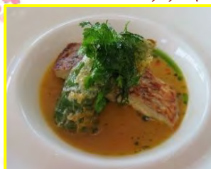
↑イトヨリ鯛のナージュ仕立て