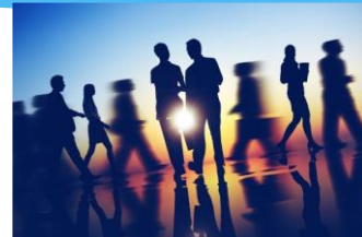
eg.) 赤ちゃんが将来就く職業の6割は今ない職業