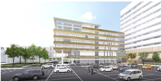
低層棟と高層棟になっている。