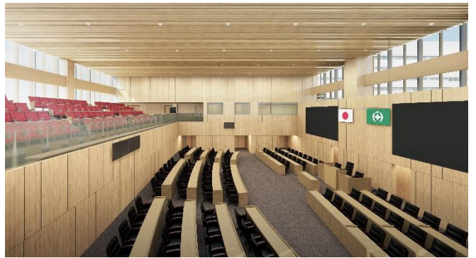
赤い場所は傍聴席