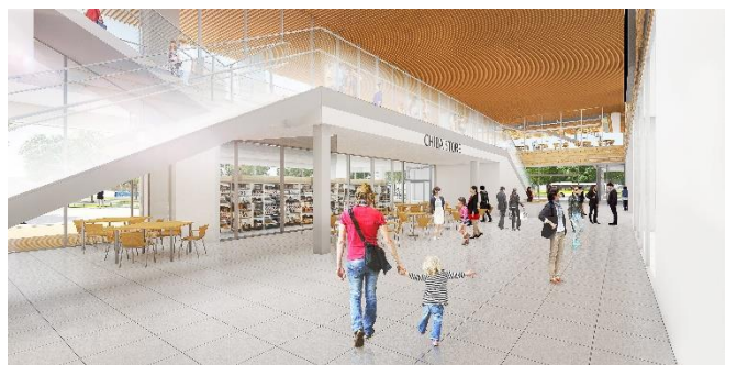
千葉市ホームページより抜粋転載させていただきました。

= 市政100周年を迎えた千葉市の新庁舎の完成・お披露目を楽しみにしています。 =