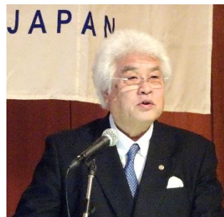
宇佐見透地区研修サブリーダー (パストガバナー・千葉幕張RC)