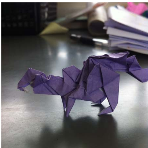
小学生の送った文章と折り紙の写真

このような派遣された教師たちが、子どもたちの成長できる教室を作るために活動しております。