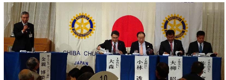
パネルディスカッション↑