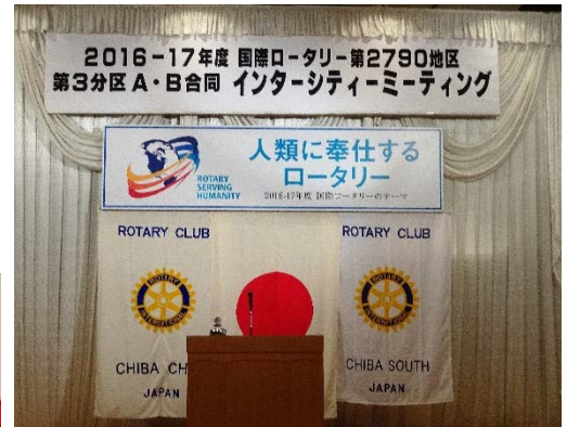
<ホストクラブ:千葉中央RC・千葉南RC>