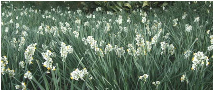
鋸南町の水仙は、越前、淡路と並び日本三大水仙群生地にも名を連ねています。