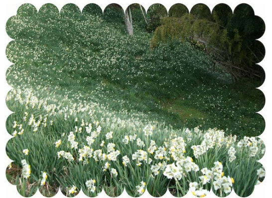
山の斜面を利用して水仙が栽培されています。