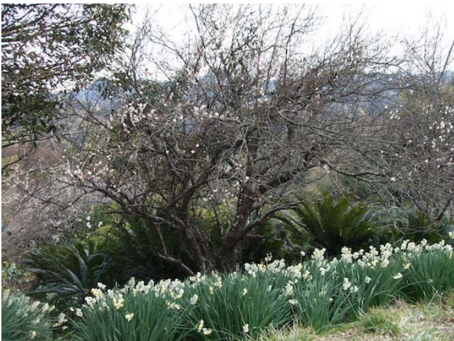
一足早い春を満喫!