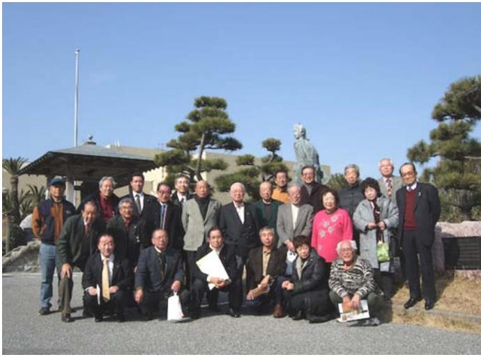
菱川師宣記念館前にて ↑