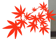
↑ (ホームページより、お写真をお借りしました。) ↑