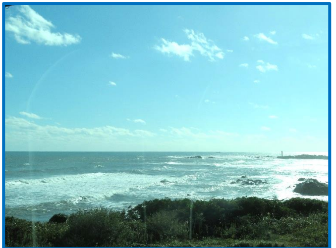
青い空が広がり波も穏やかで絶好の旅行日和でした。