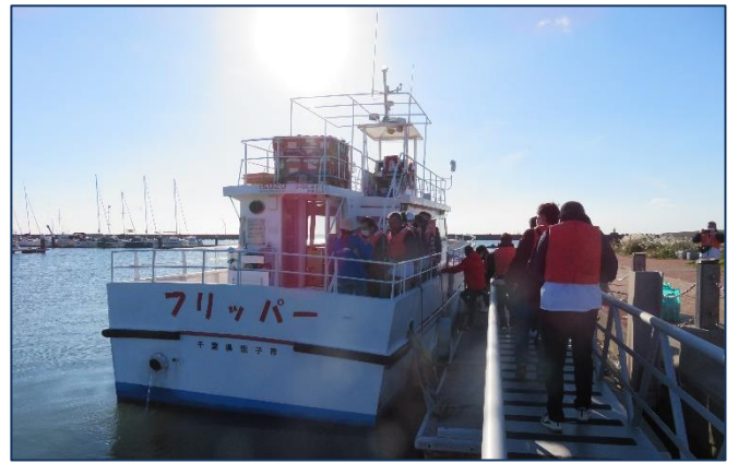
銚子海洋研究所社長 宮内様 ↑