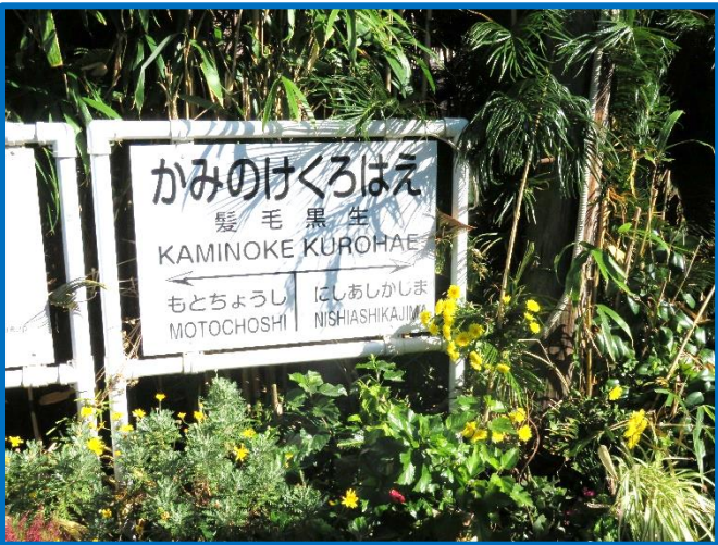
思わず笑ってしまった駅・・・