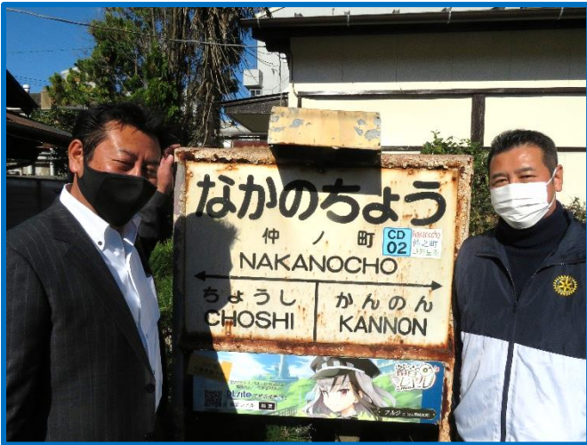
仲ノ町駅から犬吠駅まで銚子電鉄で移動しました。