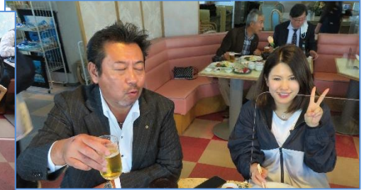
「銚子海洋研究所」を訪問