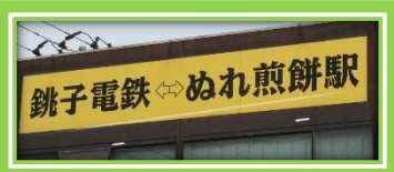
このような駅名も・・・↓