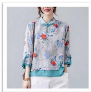
「漢服」「唐風」ファッション