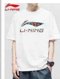
「国風」(「李宁」黒が流行)