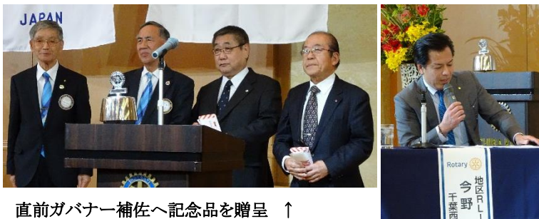
直前ガバナー補佐へ記念品を贈呈 ↑