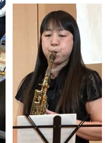
何でも演奏 知ちゃん