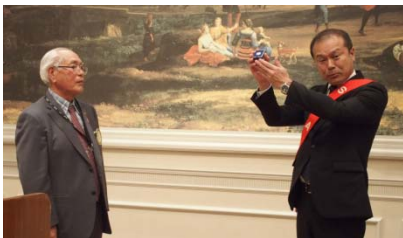
水野ロータリー財団委員長から、RIからの記念品が手渡されました。