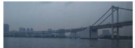
↑ レインボーブリッジがお出迎え