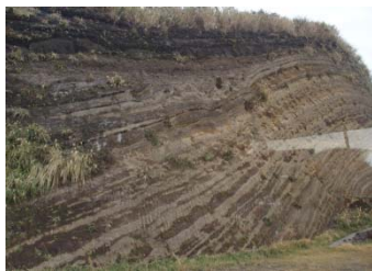
噴火史を物語る地層断面 ↑