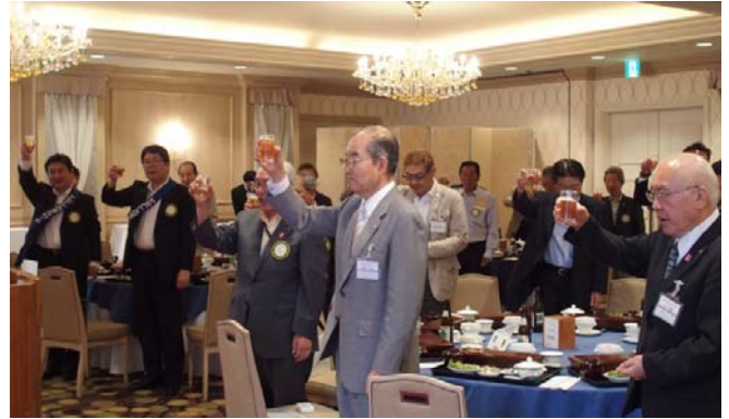
ノンアルコールビールで乾杯です