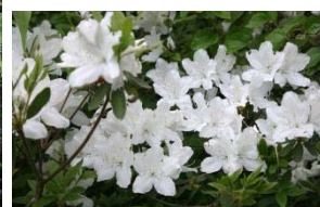
新緑の美しい季節・・・。