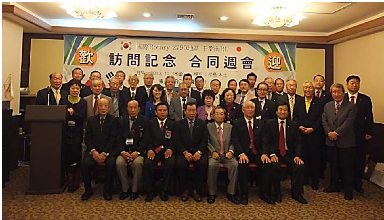
《東仁川RC・千葉南RC合同例会集合写真》 ↑