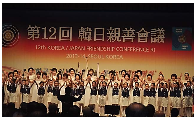
日本の歌も挿入され、素晴らしい歌声にうっとり ↑