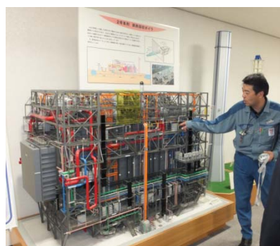
← 排熱回収ボイラーの模型 建設時に詳細設計のために作った模型をPR用に展示しています。