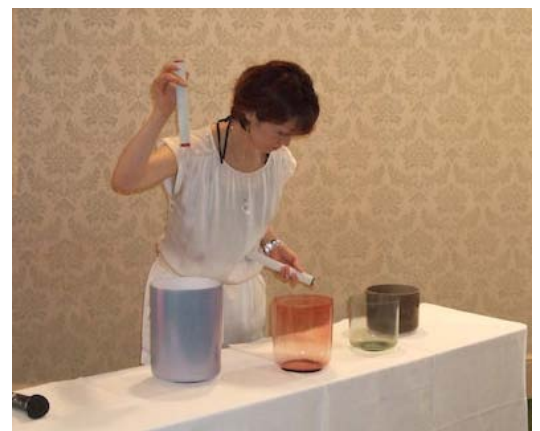
「音による癒し」 透明感のある体の奥底に響いてくる音がします