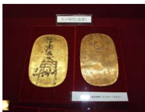
大判が保管されていました。