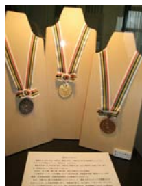
東京オリンピックメダルも作られました。